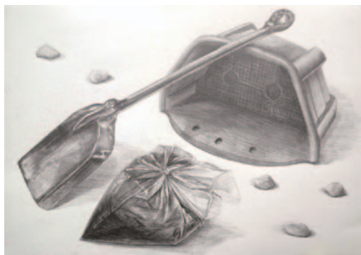
[ 卓上デッサン・鉛筆・B3・4時間 ]