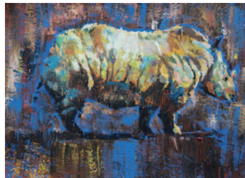
[ 色彩表現・アクリル・B3・3時間 ]