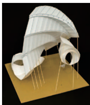
[ 立体構成・スチレンボード、ケント紙、竹ひご・3時間 ]