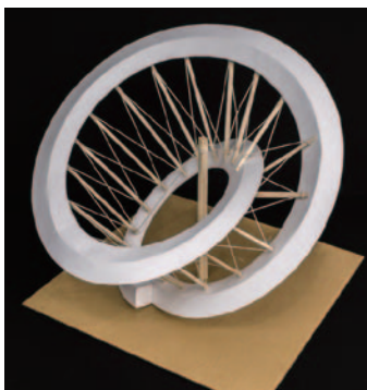
[ 立体構成・ケント紙・3時間 ]