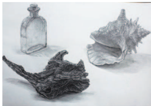
[ 細密デッサン・鉛筆・B3・9時間 ]