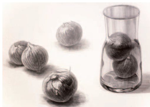
[ 卓上デッサン・鉛筆・B3・3時間 ]