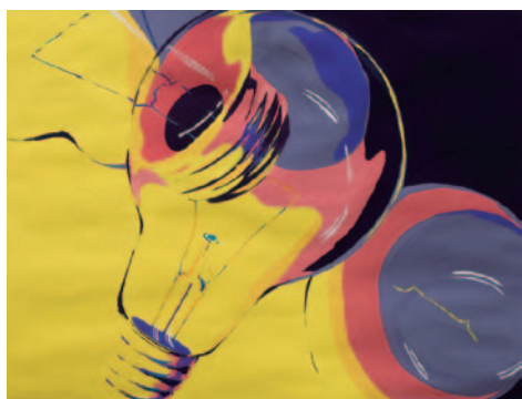
[ 色彩表現・アクリル・B3・3時間 ]